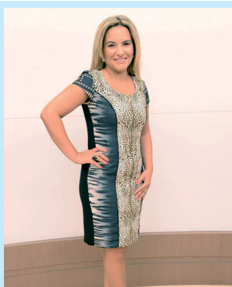
Mistura de estampas e aplicações ganharam destaque na coleção outono/inverno deste ano

Com cores diferentes e marcantes, tecidos leves e mix de estampas e aplicações, a coleção outono/inverno 2014 promete fazer sucesso entre as consumidoras e trazer bons resultados para o mercado. “Tenho certeza que as clientes estão comprando e amando a coleção, porque ela se adapta ao cliente, ao clima e ao perfil da loja”, finaliza Giselda que espera vendas significativas e resultados positivos.