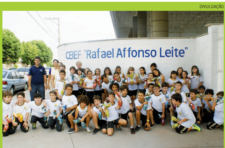
A escola municipal “Rafael Affonso Leite” foi uma das contempladas com a entrega de ovos da Páscoa